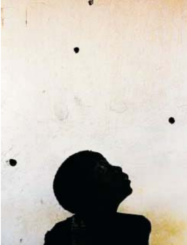
នៅអង់ហ្គោឡា ចំណុចប្រហោងស្នាមគ្រាប់កាំភ្លើងក្នុងជញ្ជាំងប្រាប់យើងអំពីសង្គ្រាមស៊ីវិលដែលធ្វើឲ្យមានជនរងគ្រោះប្រសិនបើដោយសារសង្គ្រាម២ លាននាក់

ផលលំបាកមួយគឺថា ប្រទេសទទួលជំនួយ - គិតជាមធ្យម - ត្រូវដោះស្រាយជាមួយអ្នកផ្តល់ជំនួយពី ៧ ទៅ ១២ - ដំណើរការដែលអាចធ្វើឲ្យមានការខាតបង់ថ្លៃផ្សេងៗ លុះណាតែជំនួយទាំងនោះត្រូវបានសម្របសម្រួលឲ្យបានល្អប្រសើរមែនទេ។ ក្នុងលទ្ធភាពច្រើនជាងនេះនៅក្នុងប្រទេសដែលពឹងផ្អែកលើ ជំនួយខ្លាំង។ ប្រទេសហ្ស៊ីប៊ីដែល ៤៣% នៃថវិកាអប់រំគឺជាជំនួយបរទេសធ្វើការយ៉ាងជិតស្និទ្ធជាមួយអ្នកផ្តល់ជំនួយចំនួន ២០។ នៅចុងទសវត្សរ៍ទី ៩០ ប្រទេសនេះមានកិច្ចព្រមព្រៀងលើកម្មវិធីវិនិយោគលើអនុវត្តការអប់រំមូលដ្ឋាន។ ជំនួយអប់រំត្រូវបានផ្តល់ និងគ្រប់គ្រងដោយគ្រួសារអប់រំ ប៉ុន្តែការអនុវត្តជាក់ស្តែងវិញ គេត្រូវបញ្ចូលលក្ខខណ្ឌផ្សេងៗគ្នារបស់ភ្នាក់ងារផ្តល់ជំនួយផងដែរ។ នៅប្រទេសម៉ូហ្សាម៉ិក (២៨% នៃថវិកាអប់រំបានមកពីជំនួយបរទេស) ផែនការយុទ្ធសាស្ត្រផ្នែកអប់រំត្រូវបានអនុម័តនៅឆ្នាំ ១៩៩៨ បង្កើតឲ្យមានផែនការរួម និងវត្តមាននៃការតាមដាន ត្រួតពិនិត្យ ដែលស្ថិតនៅក្រោមការដឹកនាំដ៏រឹងមាំ របស់រដ្ឋាភិបាល។