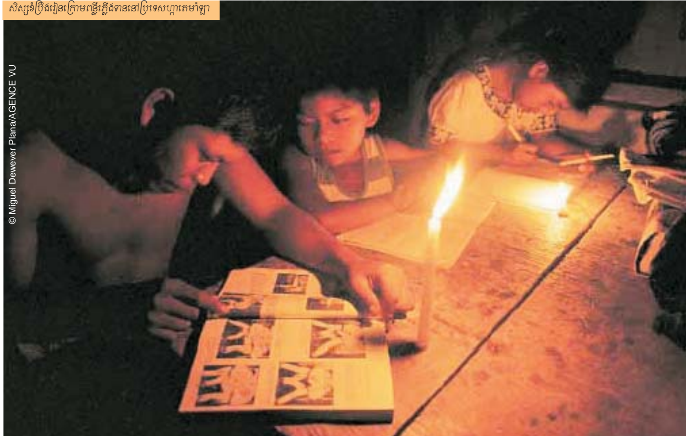
សិស្សទំព្រឹងរៀនក្រាមខ្លីភ្លើងទាននៅប្រទេសហ្គានេស៊ី

កុមារយ៉ាងច្រើននៅលើពិភពលោកបានទទួលនូវភាពអយុត្តិធម៌ដោយសារការបដិសេធន៍មិនឲ្យទទួលបានប្រយោជន៍ពីការអប់រំ ព្រោះកុមារទាំងនោះមានលក្ខណៈផ្សេងពីកុមារដទៃ។ តាមការប៉ាន់ស្មានឲ្យដឹងថា នៅលើសកលលោក មានកុមារពិការប្រមាណជា ១៥០ លាននាក់ ហើយក្នុងចំណោមនោះមានកុមារតិចជាង ២% ដែលបានចុះឈ្មោះចូលរៀននៅសាលា។ ការពិការភាពលើដៃម្រីសវិធីគាំទ្រដោយដាក់បញ្ចូលកុមារទាំងនោះទៅក្នុងសាលាទូទៅ និងការទាមទារឲ្យមានសាលាពិសេសសម្រាប់កុមារប្រភេទនោះពុំទាន់ត្រូវបានដោះស្រាយនៅឡើយទេ។ បើពិនិត្យលើគុណភាពអប់រំ វិធីមួយក្នុងចំណោមវិធីទាំងពីរនេះមានចំណុចដែលត្រូវពិចារណាច្រើន។ នៅក្នុងប្រទេសមួយចំនួន គ្រូបង្រៀនដែលទទួលបានការបណ្តុះបណ្តាលពិសេសទទួលបានប្រាក់កម្រៃតិចជាងកំរិតស្តង់ដារដោយសារត្រូវទាំងនោះត្រូវបង្រៀនសិស្សតិចជាងគ្រូធម្មតា។ ការអប់រំដោយការដាក់បញ្ចូលគ្នាដែលត្រូវចំណាយច្រើន - សម្រាប់កែលម្អកម្មវិធីសិក្សា ការបណ្តុះបណ្តាលគ្រូ